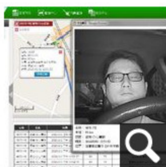
全球最先進的駕駛注意力監控系統

今年「大甲媽祖」APP除了提供媽祖神轎位置、超商、速食店、宅急便、盥洗車、天氣等資訊外，特別針對參與遶境進香活動的現場民眾，提供個人化服務功能，讓民眾可隨時記錄自己跟轎的足跡、照片、註記等資訊，在跟隨著媽祖腳步的同時，也可隨手記錄自己的跟轎日記。